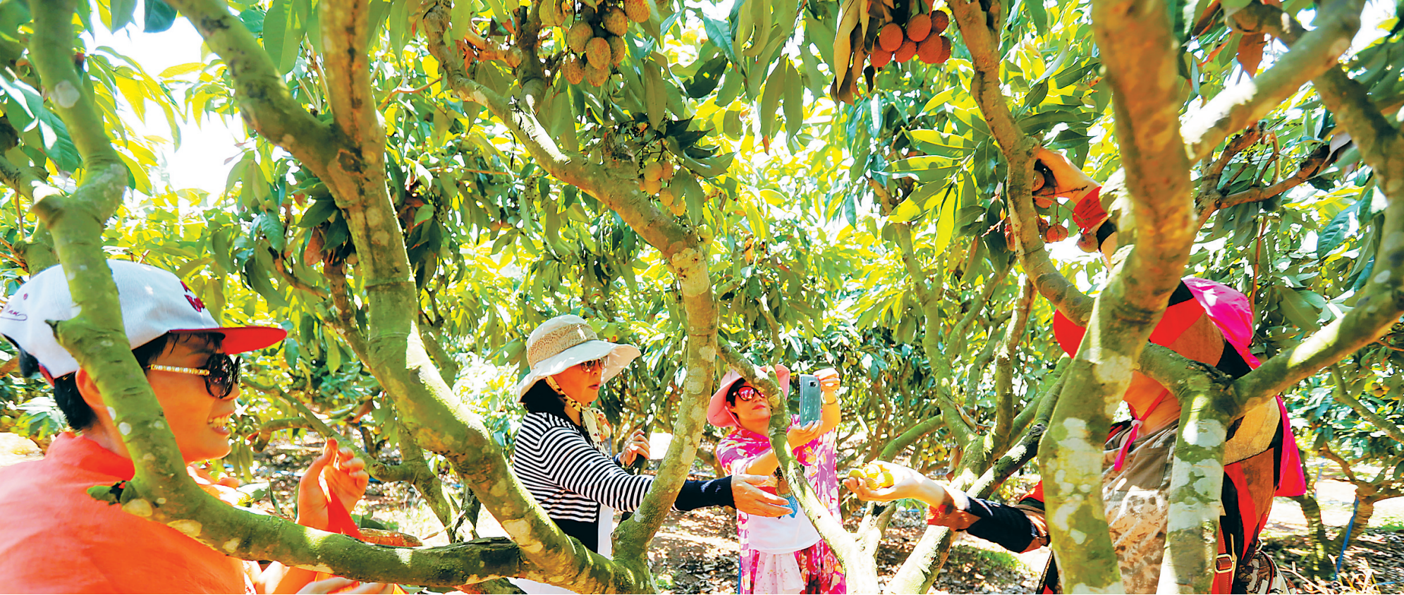
日前，海口游客在澄迈县福山镇侯臣美丽乡村荔枝园采摘荔枝。