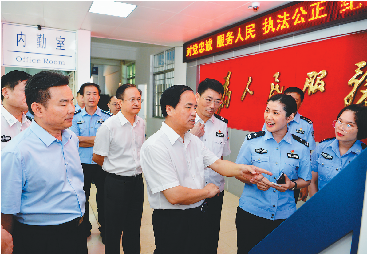
5月25日，省委书记刘赐贵赴省公安系统调研。图为在海口市公安局滨江派出所，刘赐贵详细了解自助一体机办理签注流程。

刘赐贵特别强调，全省广大公安干警要坚持以人民为中心的发展思想，把群众利益放在首位，做人民群众的贴心人。要站在群众角度想问