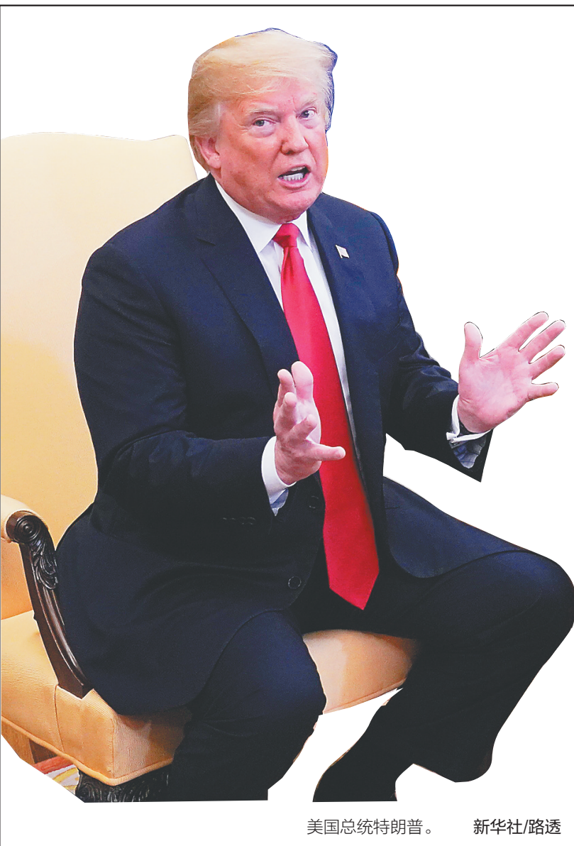
美国总统特朗普。

据新华社巴西利亚5月25日电（记者张启畅）巴西南部戈亚斯州消防部门25日通报说，州府戈亚尼亚一少年犯关押中心当天发生火灾，火灾造成9人死亡、1人受伤。 消防部门说，当天11时30分左右，消防人员前往该关押中心救火。火灾是由部分在押人员点燃房内的床垫引起的，随后火势蔓延。当时共有11人在起火区域，目前火灾已导致9人死亡、1人受伤。