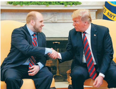
5月26日，美国总统特朗普(右)在华盛顿白宫与从委内瑞拉获释的美国公民乔舒亚·霍尔特握手。