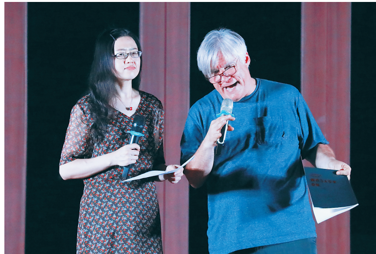
晚会上,外国诗人(右)朗诵诗篇。