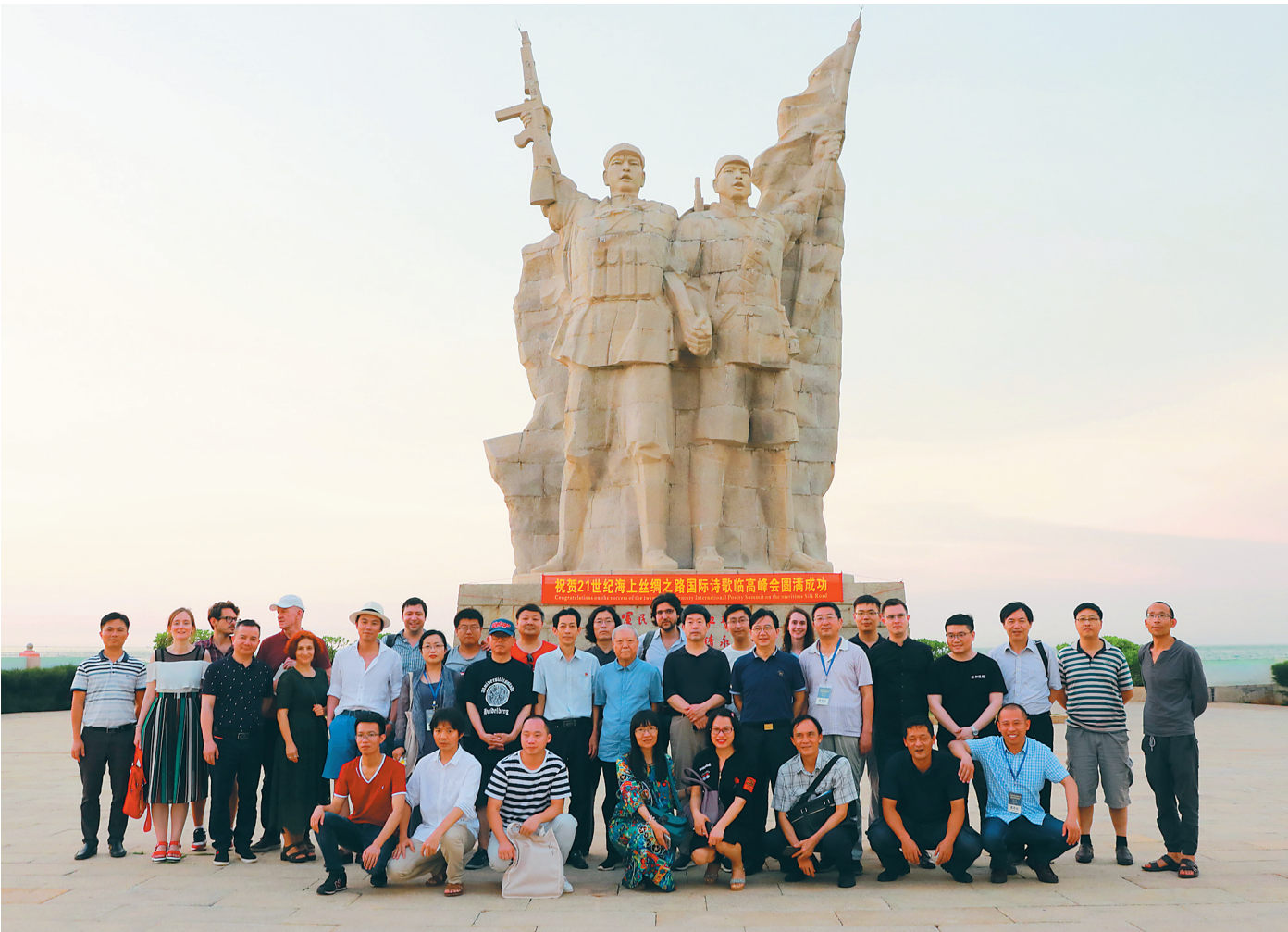
“21世纪海上丝绸之路国际诗歌临高峰会”部分与会人员合影。