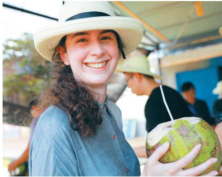
外国诗人品尝椰子。