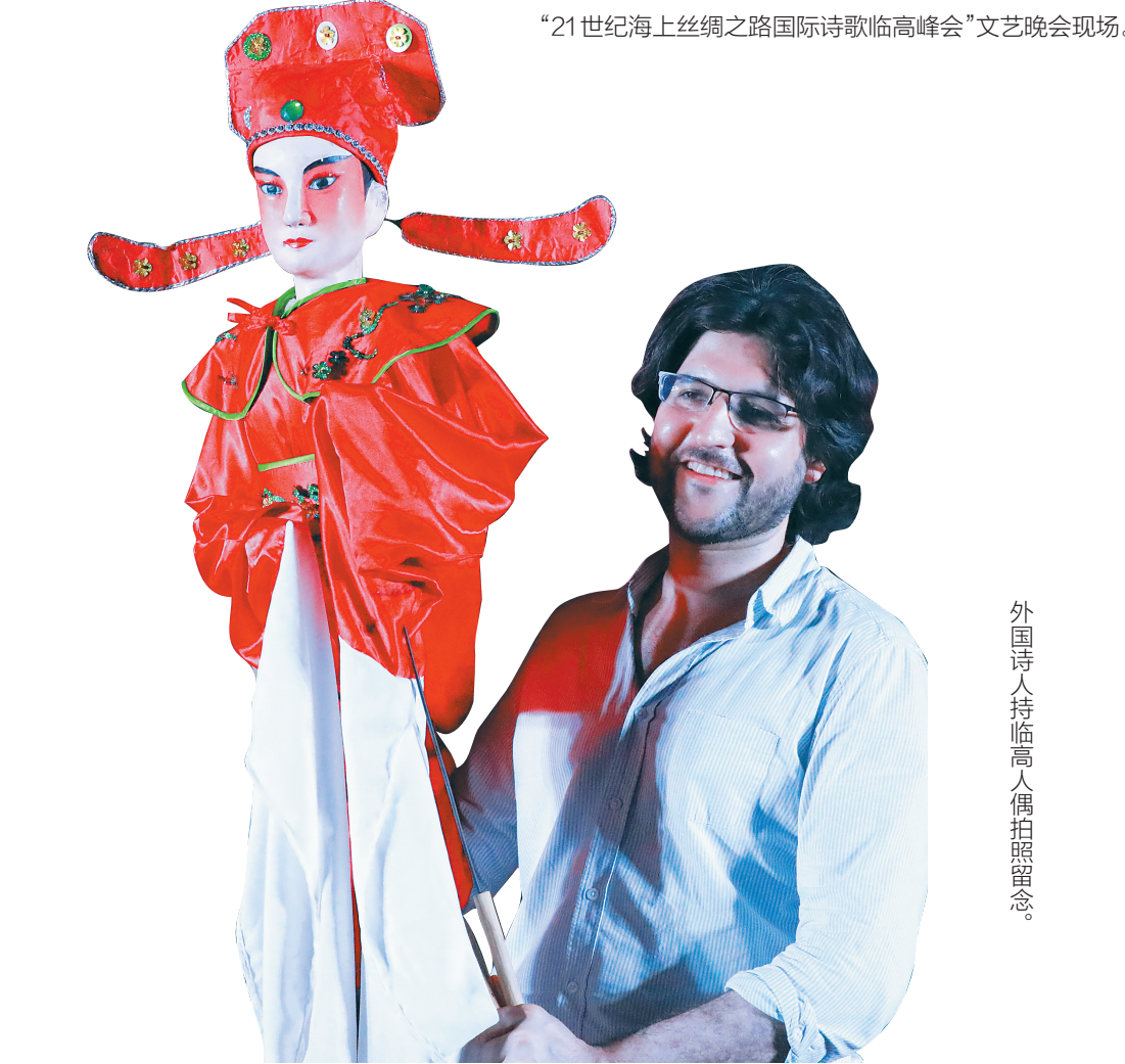
外国诗人持临高人像拍照留念。