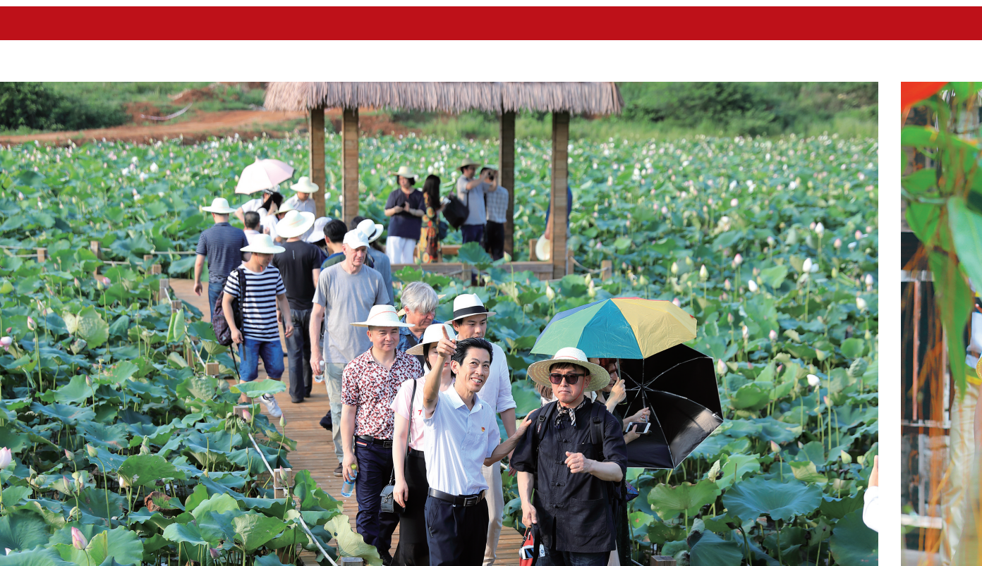
与会诗人在临高的美丽乡村采风。