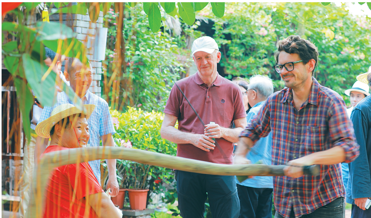
与会外国诗人在农村体验劳动的快乐。

5月17日至20日,“21世纪海上丝绸之路国际诗歌临高峰会”(以下简称诗歌峰会)在临高举办。诗歌峰会由中共临高县委宣传部与中国作家协会《诗刊》社联合主办。诗歌峰会以“21世纪海上丝绸之路”为主题,吸引了来自中国、美国、英国、法国、俄罗斯、澳大利亚、韩国、意大利、捷克、丹麦、智利、越南、阿根廷等十余个国家的诗人与嘉宾近百人齐聚临高,围绕“21世纪海上丝绸之路与当代海洋诗歌”这一主题探讨全球化语境下的新时代诗歌的发展,以及当代海洋诗歌的独特魅力和重要价值。