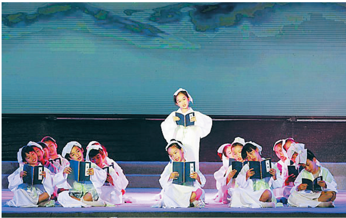
“21世纪海上丝绸之路国际诗歌临高峰会”文艺晚会现场。

与新的历史时期,抓住新机遇,寻找新动力,拓展新空间,开辟美学新领域,确立美学新典范,是当代诗歌的应由之路。积极展开对话与交流,取长补短,相互学习,共同进步,营造多互互动、百花齐放的诗歌发展局面,达到‘各美其美,美人之美,美美与共,天下大同’的理想境界,是21世纪海上丝绸之路诗歌建设的必由之举。 21世纪海上丝绸之路的历史新通道,已经开启。21世纪的海洋诗歌,已迎来新的创作浪潮。让我们胸怀海洋,放眼世界,吾往知来,不忘初心,砥砺前行,用最充沛的激情、最美妙的语言,唱响新时代海洋诗歌的最强音,奏响人类文明全球化的交响曲。 诗歌峰会开幕式现场。