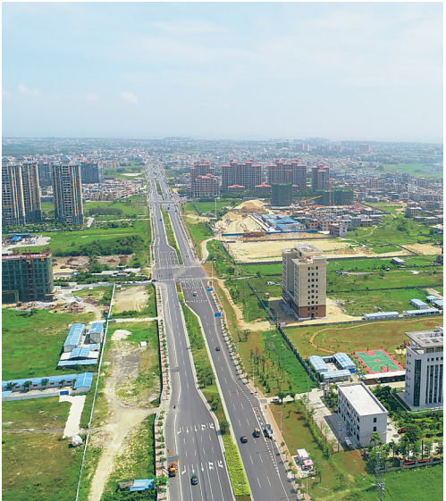
海口江东新区。

据介绍,江东新区概念性规划方案国际化招标工作于北京时间2018年6月3日16时正式启动,应征机构须在6月22日前提交资格预审申请文件。经权威专家组成的专家委员会评审后,6月27日前确定通过资格预审的10家投标机构,中标单位经实地踏勘和调研后9月份提交设计方案。专家评审委员会将对设计方案进行综合评定,选取优秀方案1个、优良方案2个,并给予奖励。