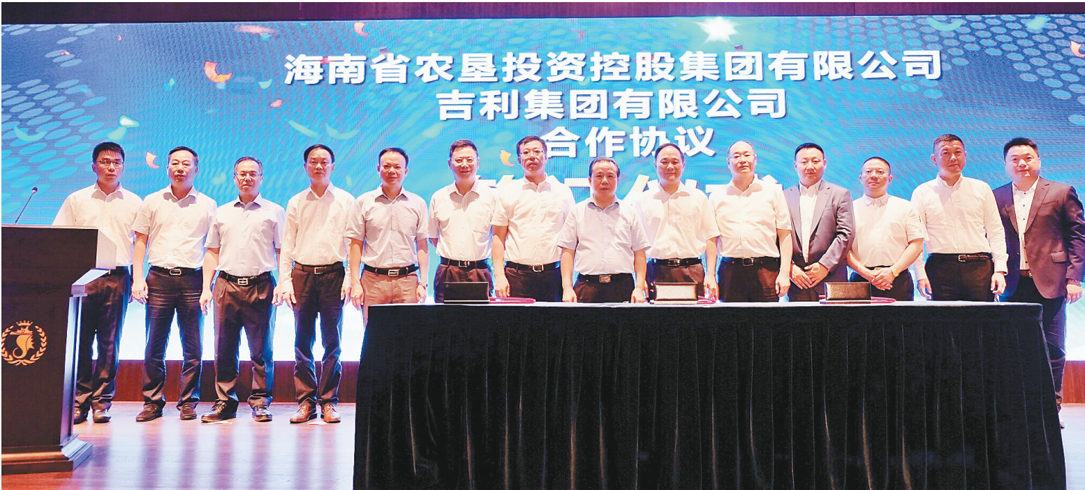
6月3日下午,海南省农垦投资控股集团与吉利集团在海口签署战略合作框架协议,双方充分整合各自优势资源,共同在海南打造绿色、智能、高效的出行方式。

6月3日下午,海南省农垦投资控股集团与吉利集团在海口签署战略合作框架协议,双方将充分整合各自优势资源,共同在海南打造绿色、智能、高效的出行方式,加快推进海南能源消费结构调整,推动海南国家生态文明试验区建设。 双方将围绕“小灵狗出行”“曹操专车”以及甲醇燃料及甲醇汽车、飞行汽车等4个方面展开合作,共同助推海南绿色智能出行,有效改善海南空气环境,极大方便广大居民、游客出行。双方还将利用海南得天独厚的海洋、海岛旅游资源优势,将引入Terrafugia飞行汽车共同发展高端旅游产业。