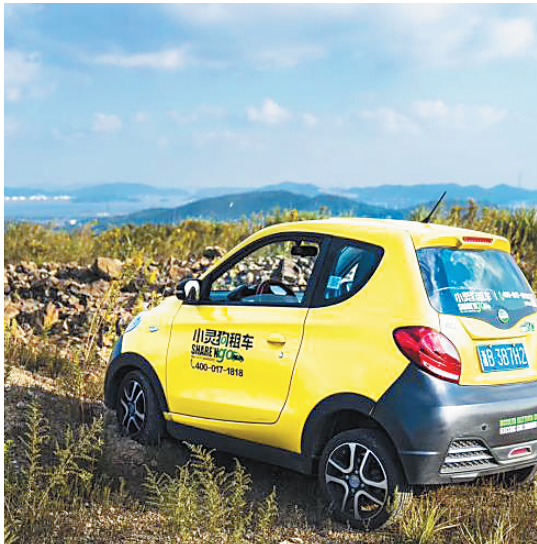
“小灵狗出行”提供短租、长租、租售二手车等多种业务。消费者能够以每月不到1000元的花费轻松“拥有”一台自己的汽车。

2018年,“曹操专车”已接入全国桩数90%,并获得优惠的协议价格。通过与合作桩企互联互通,使“曹操专车”司机可以在司机端上充电,且在平台上实现资金结算。 本版策划撰文/品观