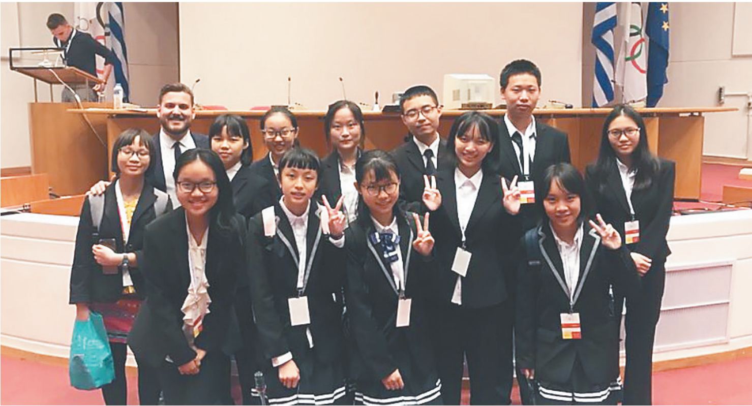
日前,海中12名学生赴希腊参加联合国教科文组织举办的世界文化遗产青年研讨会。