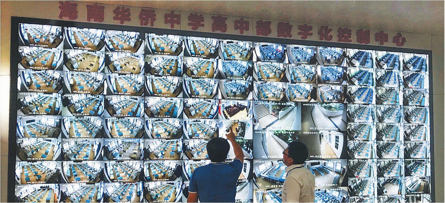
六月五日，在海南华侨中学高中部，老师们在数字化控制中心监控高考考场。

考场，或保证下一科考前送到，将情况报告考点主考。考点主考掌握无准考证进场应考的考生情况，如果确系丢失，由市县招生办与该生所在学校带队老师核实确认其身份；如系考生忘记带，由考生领队取来送至考场。确系丢失的，确认后经市县招办主任批准补发。 其他考场规则及答题注意事项可登录省考试局网站查看。