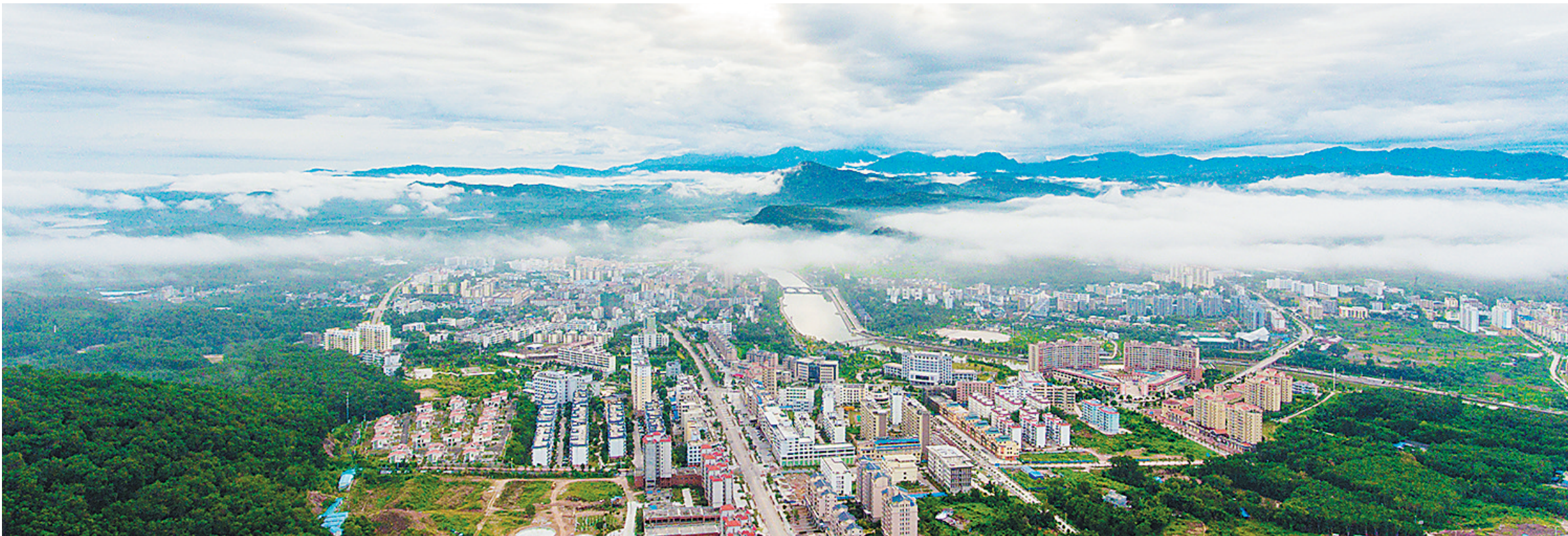
鸟瞰有“山水黎乡,绿韵白沙”之称的白沙黎族自治县县城。