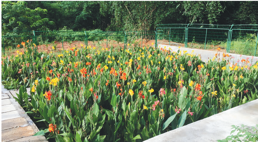
翁村二队花园式的人工湿地。

“走,我们到对面花园散步去!”5月31日傍晚,家住白沙黎族自治县元门乡翁村二队的村民卢文南刚陪孩子做完家庭作业,正准备去“花园”看一看。卢文南口中