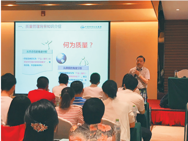
5月29日至30日，省质量技术监督局组织的ISO质量和环境管理体系标准培训班，为三亚市旅游服务企业开展培训。

认证认可，是由独立第三方证明产品、体系、人员或机构符合要求的合格评定手段，满足了人们对于质量安全和交易便利的期望，从源头上提高质量，在各方之间传递信任，具有独立性、专业性、国际化、市场化等特点，因而获得广泛应用。联合国工业发展组织(UNIDO)和国际标准化组织(ISO)将认证认可与计量、标准一起，作为国家质量基础设施的三大支柱。 省质量技术监督局相关负责人表示，作为国家质量技术监督基础之一的认证认可工作，要通过在供需之间传递信任机制，服务市场监管。在质量提升行动中，有关部门要切实发挥强制性产品认证、检验检测机构资质认定这些准入门槛的作用；同时又要促进企业加强质量管理，开展质量管理体系认证，提升质量管理水平，满足消费需求升级的需要，让消费者能够更多享受高品质消费品和服务，增加高端质量供给，打造“海南质量”“海南品牌”。