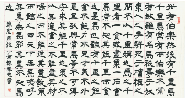
韩辉定的隶书作品