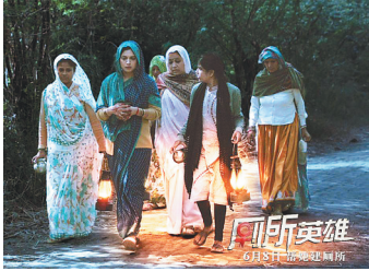
印度农村妇女深夜到郊外如厕。