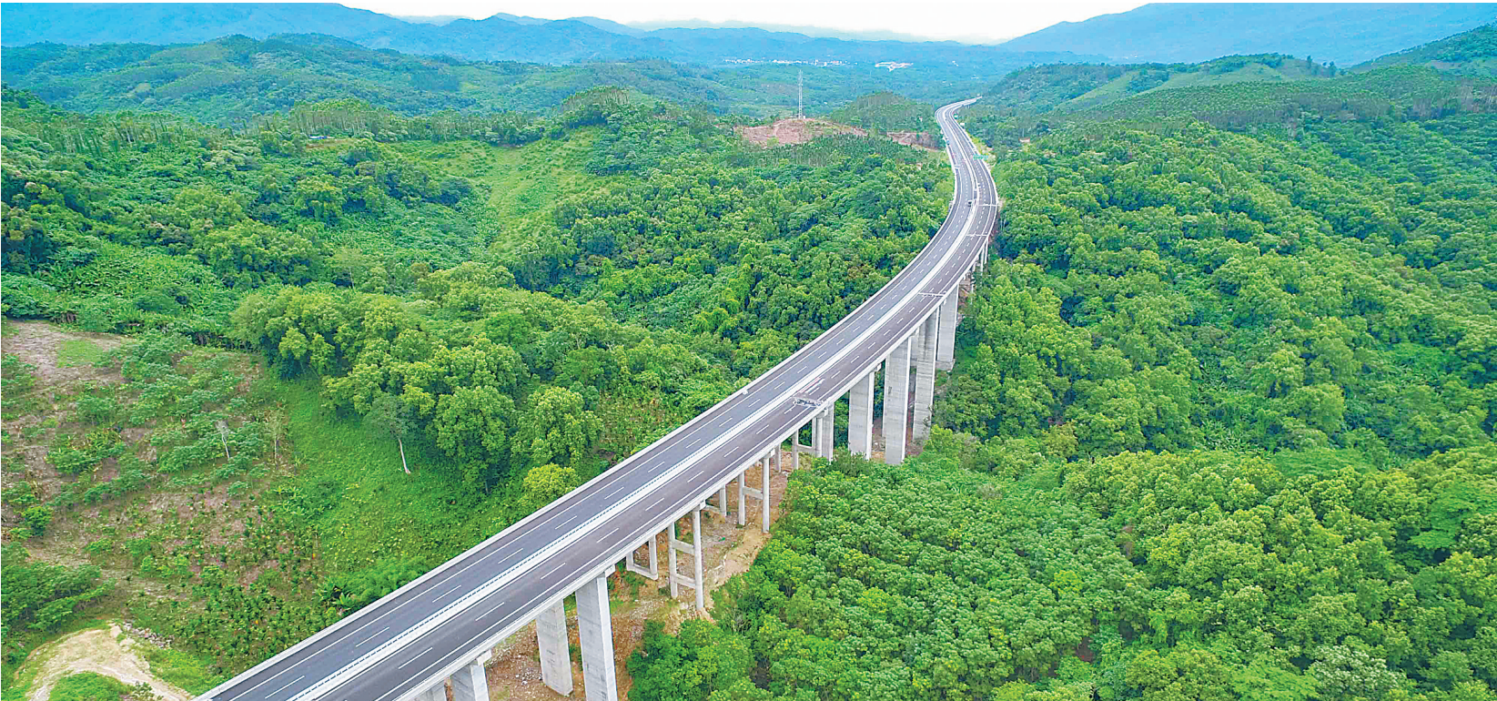
鸟瞰琼乐高速路面施工标段第一合同段，这是琼乐高速全线首个完成路面沥青施工任务的标段。