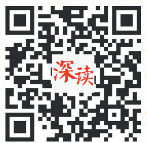
扫一扫看H5产品 老宅传奇