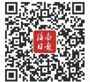
扫一扫看视频 老宅背后的故事

在海南各地 散落着不少老宅 各有不同的故事 却寄托相同的“乡愁” 它们中的多数 正等待着“新生”