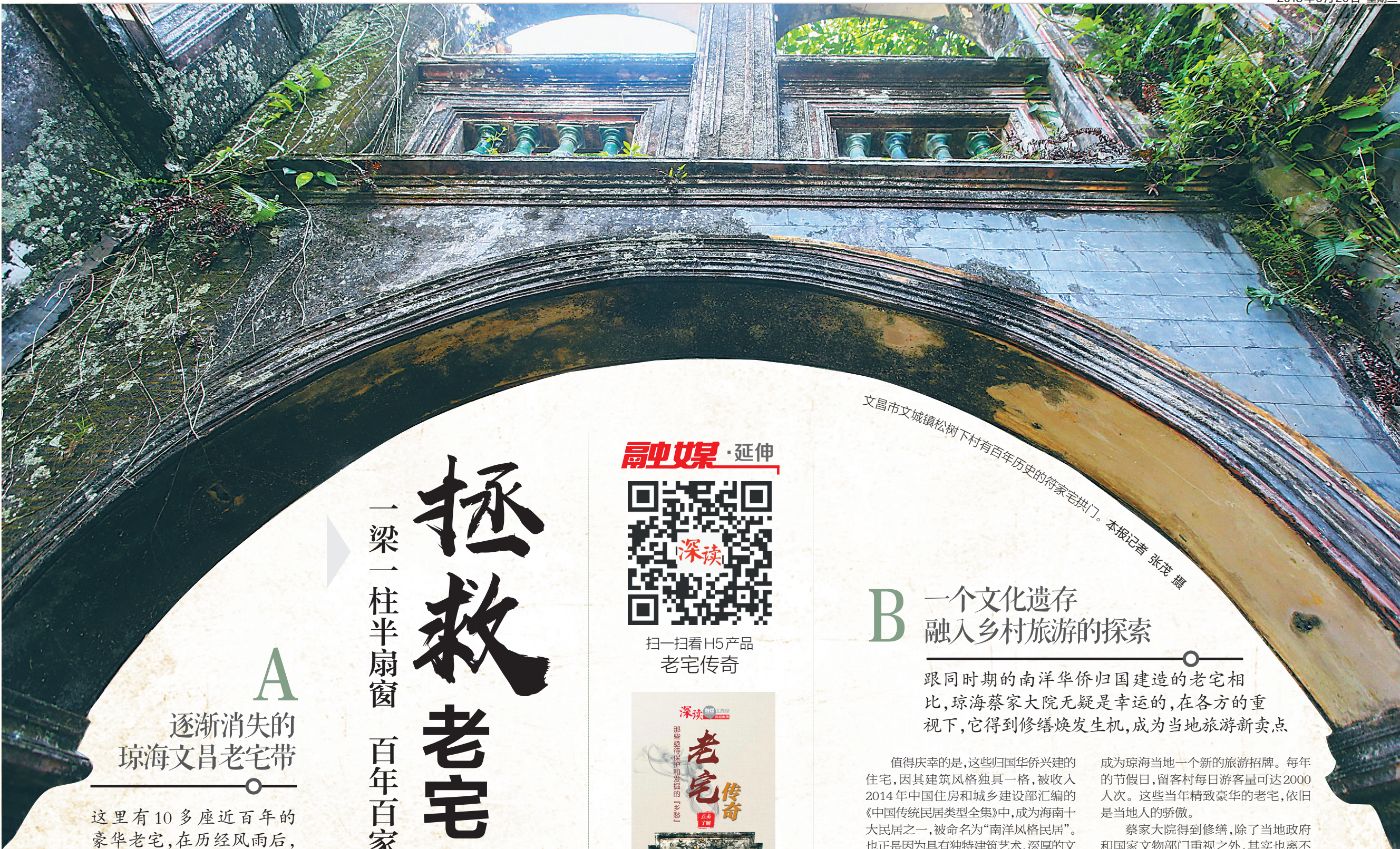
文昌市文城镇松树下村有百年历史的符家宅拱门。