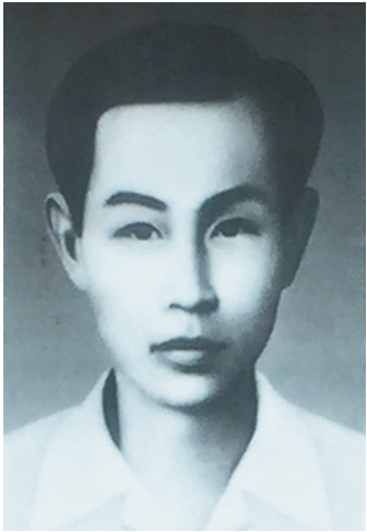
王文明像（资料照片）。新华社发

据新华社海口6月20日电（记者赵叶苹）王文明，1894年出生于广东乐会（今海南琼海），字钦甫。1917年至1920年，在琼崖中学读书时，王文明参与领导了爱国学生运动，曾被选为琼崖学生联合会副会长、抵制日货总会会长。