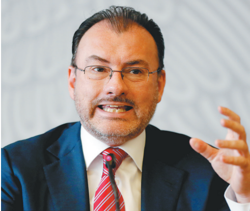
6月19日，在墨西哥首都墨西哥城，墨西哥外交部长路易斯·比德加赖出席新闻发布会时讲话。路易斯·比德加赖19日说，墨西哥政府以“最坚决和强硬”的态度，谴责美国政府强行将移民儿童与父母分离的举措。

其次，此次“退群”与特朗普政府在处理非法移民问题上面临的人权指责也不无关系。据美国政府15日公布的数据，在截至5月底的短短一个半月内，美执法人员将近2000名移民儿童强行与父母分离，理由是一些父母涉嫌非法移民。美国政府这一举措饱受诟病，被批无视儿童权益。 第三，特朗普政府上台以来大力推行“美国优先”政策，与崇尚多边主义的联合国一直格格不入。加尔迪耶里对新华社记者表示，特朗普政府在处理国际关系时更看重“交易性”和能为美国带来的“利益”，在这种情况下，美国不会重视旨在推动人权发展的国际组织。 (据新华社华盛顿6月19日电)