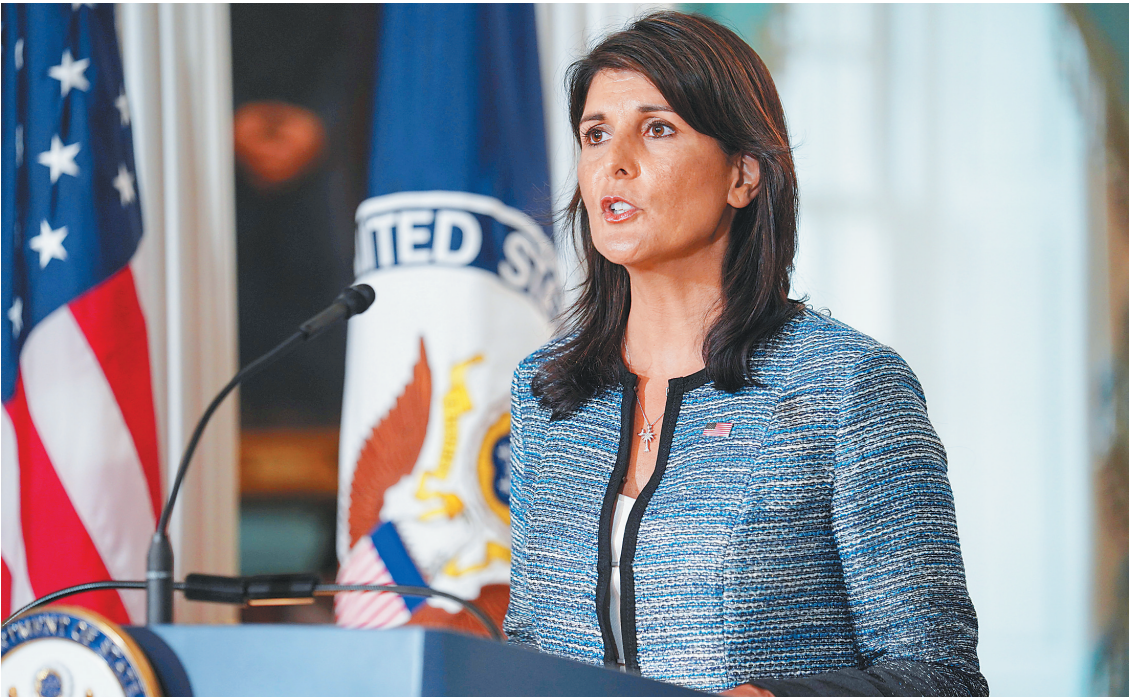
十九日，美常驻联合国代表黑莉宣布美国退出联合国人权理事会。

美国常驻联合国代表妮基·黑莉19日在美国国务院发布这一决定。黑莉指认联合国人权理事会会对以色列“长期抱有偏见”、“不相称的关注”和“无休止的敌意”。 人权理事会长期把“巴勒斯坦及其他阿拉伯国家被占领土的人权状况”列为会议议程，审议以色列涉嫌在巴勒斯坦被占领土侵害人权的行。美国一直要求取消这项议程。理事会投票表决谴责以色列对加沙地带行动的决议时，美国总是投反对票。 黑莉在讲话中用大量贬义词描述人权理事会，将矛头指向理事会其他成员，批评他们阻挠美方提出的改革方案，“不愿挑战现状”。在场的美国国务卿蓬佩奥也支持这一说法，称联合国人权理事会已“无法有效保护人权”。 美方所提改革方案包括把人权状况糟糕的成员“踢出”这一机构的内容。按照现行规则，取消理事会成员国资格需要得到联合国大会表决，三分之二以上投票通过，美方希望降低这一门槛。 人权理事会2006年设立，共设47个席位，成员由联大选产生，每届任期三年，连续两任后须间隔一年方可寻求新一届任期。美国最初拒绝竞选理事会席位，贝拉克·奥巴马担任总统期间才参加竞选，进入这一联合国机构，这届任期原本应持续至2019年。按照路透社的说法，美国是人权理事会设立以来第一个在任期内主动退出的成员国。 黑莉暗示，美方这一决定并非“永久不变”，如果理事会采纳美方改革提议，“我们乐意重新加入”。