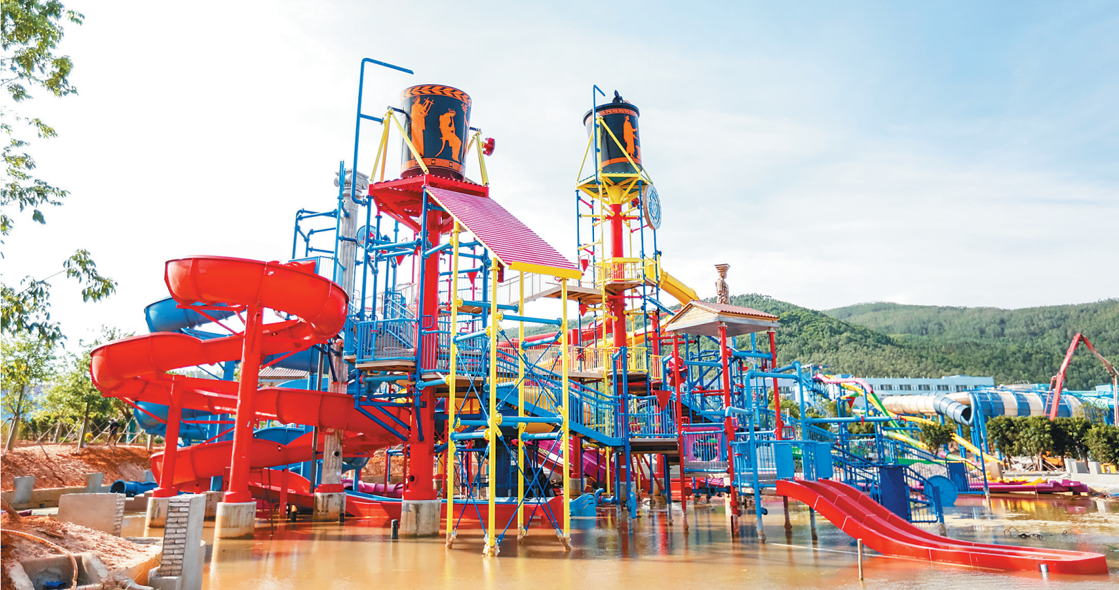
6月21日，富力海洋欢乐世界“魔幻水寨”滑道已铺设完成。