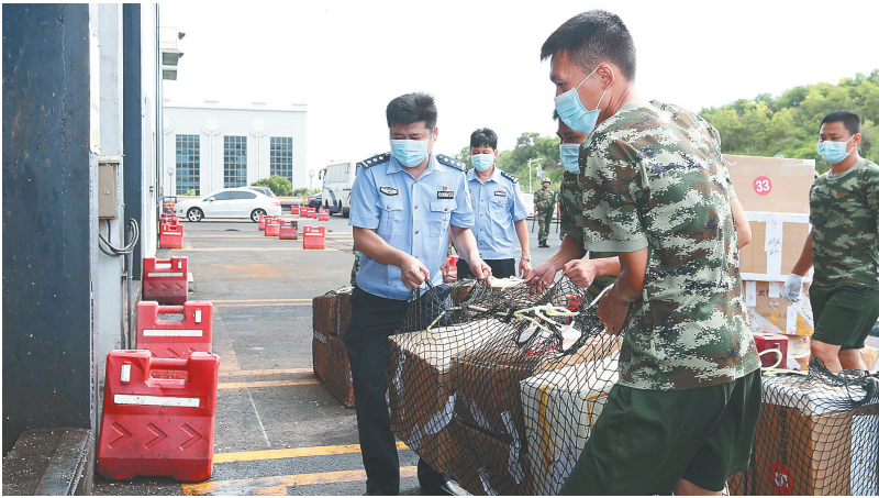
6月22日，民警将毒品投送到海口焚烧发电厂焚烧并进行无害化销毁。

式处理。 据了解，2016年11月8日以来，省委、省政府在全省范围内部署开展声势浩大的禁毒三年大会战，坚决向毒品宣战，强力攻坚“八严”工程，持续掀起了禁毒人民战争新高潮，推动禁毒工作取得显著战果。