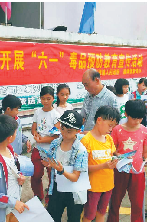
5月31日，海口市龙华区遵谭镇开展庆“六一”毒品预防教育宣传活动。

2017年，龙华区禁毒工作取得丰硕成果，今年，该区将继续总结经验，并在此基础上弥补不足，推动禁毒工作规范化、制度化、常态化。据了解，龙华区将着力强化禁毒工作责任，推动禁毒工作规范化、制度化、常态化；持续加大禁毒打击力度，坚持严打整治方针，形成“全覆盖、常态化”的打击态势，增强物流寄递、铁路、公路以及网络毒品犯罪的缉查力度，阻断毒品供应链，使毒品进不来、藏不住；充分发挥村(居)禁毒工作站作用，加强吸毒人员登记管理和社区网格化管理服务，不断提高“6+N”帮教工作成效，并将村(居)禁毒经费纳入2018年财政预算，切实提高保障水平。此外，值得一提的是，今年龙华区委、区政府将投资450万元在义龙中学“龙华区青少年活动中心”建设一个现代化的毒品预防教育基地，充分利用这一平台把全区禁毒教育引向深入并作为毒品预防师资培训基地，着力解决宣传教育深度、广度、直观度、形象度、震撼力和常态化的问题。(策划/曹果 文/曹果 刘伟)