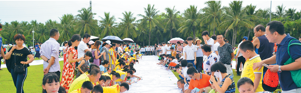
6月23日上午，2018年“6·26”国际禁毒日“开放海南·绘画无毒人生”万人彩绘主题活动在万绿园举行。

根据全省禁毒三年大会战“严奖”“严责”工程具体实施方案，龙华区制定印发了《海口市龙华区禁毒三年大会战“严奖”“严责”工程实施方案》，针对每个阶段会战事态和走向，适时研究、制定考评办法和推进措施，对各单位任务进行量化分解，精准实施考评，严格兑现奖惩，全年先后对235名举报毒品违法犯罪有功人员、大会战第一阶段23个先进单位和42名先进个人、在册吸毒人员摸底排查中表现突出的公安龙华分局和6个镇(街)及在“6·27”工程中成绩突出的12所学校实施奖励；对禁毒工作进展缓慢滞后、敷衍塞责的单位或个人，依照《海南省禁毒工作责任制规定》进行约谈、问责。通过精准实施考评，严格兑现奖惩，充分表明了龙华区委、区政府对禁毒工作务求必胜的态度和决心，促使“八严”工程各指挥部和各镇(街)的禁毒主体责任意识进一步开展，争先创优、比、学、帮、赶、超成为新常态。龙华区还坚持预防为主，防范为先，组织开展一系列形式多样、内容丰富的禁毒宣传教育活动，在全社会倡导“健康人生、绿色无毒”理念，形成浓厚的社会禁毒氛围。自禁毒三年大会战启动以来，龙华区组织1万多人次网上参观“中国数字禁毒展览馆”，组织27541名学学生参加全国、全市青少年禁毒知识竞赛。在社会宣传方面，龙华区切实发挥禁毒教育园地、禁毒教育专栏、永久性禁毒广告牌、楼宇电视、户外大屏幕的阵地作用，面向市民群众广泛开展禁毒公益宣传。继在汽车南站、高铁东站、万绿园、双创广场等公共场所建设禁毒宣传阵地后，又在世纪公园、金牛岭公园分别建立了大型开放式禁毒教育园地，组织全区机关单位干部职工、中小学校师生近2万人参观。