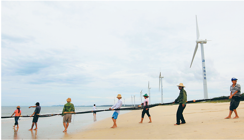
铺前渔民拉网捕鱼。(资料照片) 海南日报记者 宋国强 摄

提起文昌市铺前镇,大多数人想到的可能是铺前马鲛鱼、铺前糟粕醋,这两种特色海产和小吃,让铺前这个名字潜移默化地走进人们心中。