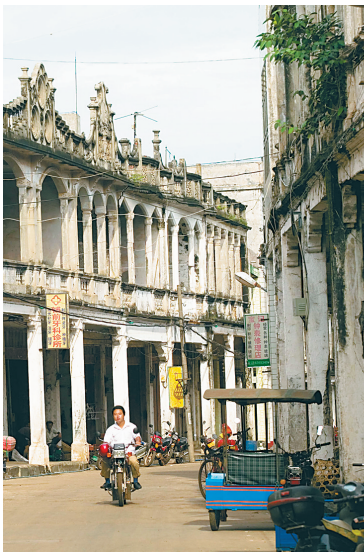
文昌铺前骑楼老街。

“蔚蓝海岸”系列报道首先从海南渔港开始,以琼北、琼东、琼南、琼西四个地理方位,精选海南有特点、有故事的渔港,分别从历史、地理、人文、海产等方面入手,深入整理海南渔港文化。开篇将走进琼北渔港,为您讲述铺前港、清澜港、东寨港、东水港和玉包港的故事。