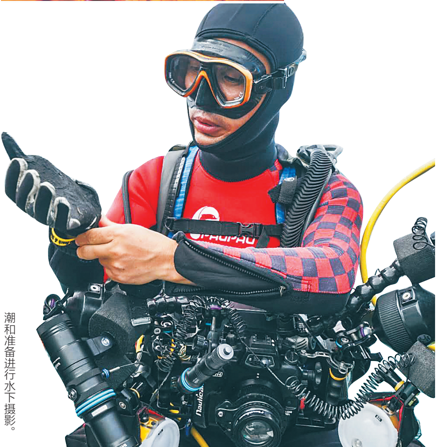
潮和准备进行水下摄影。

枪虾虽小,但也是带“枪”的,这只生活在菲律宾海域火焰海胆身上枪虾只有1.5cm长,比海胆的刺大不了多少。