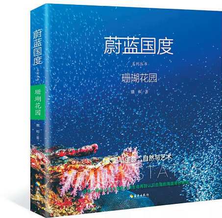
《蔚蓝国度之珊瑚花园》封面

曾经,当身边所有人都劝他把赚来的钱投资买房时,他却坚决要把自己的全部身家“扔海里”!销声匿迹5年后,他终于浮出海面,为大家呈现一个全新的海底世界。