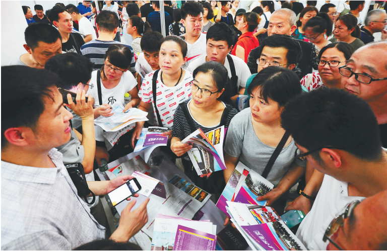
近期,我国各地纷纷举办2018年高校招生咨询活动,高校工作人员现场解答考生和家长关于高考志愿填报的问题。