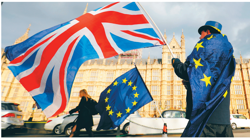
这是2018年3月28日在英国伦敦英国议会大楼前拍摄的英国国旗和欧盟旗帜。