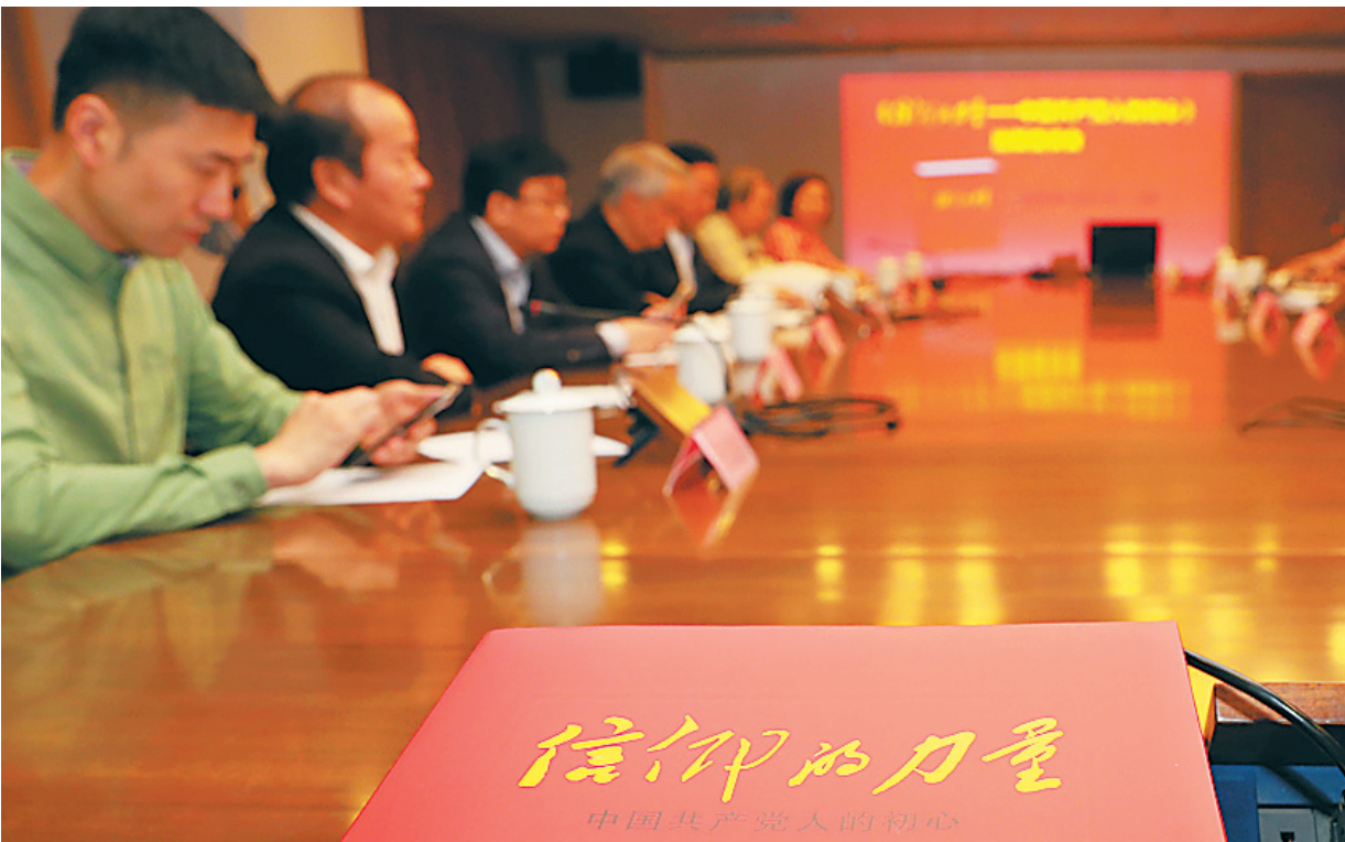
5月21日，《信仰的力量——中国共产党人的初心》出版座谈会在上海书城举行。