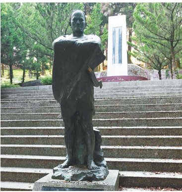
莫那·鲁道雕像资料照片。

据新华社台北7月6日电 莫那·鲁道,1882年生于台湾南投大山里的雾社部落。他强健魁梧、胆识过人、公道正派,是受到敬重的部落首领。 日本侵略者对台湾少数民族同胞采取“理番”政策,进行了长达数十年的屠杀征讨。1929年前后,日本殖民当局在雾社等地大肆掠夺森林和矿藏等资源,强迫少数民族同胞从事非人的劳动。由于不堪压榨和凌辱,莫那·鲁道带领雾社族人,联合马赫坡、波瓦仑、斯固等多个部落,于1930年10月27日,利用殖民当局搞“神社祭日”、举办运动会的时机发动起义,袭击日本警察派出所13处,杀死日本人134名,破坏电线和通信设施,引起巨大震动,史称“雾社起义”。 起义爆发后,日本殖民当局出动军警1400多人,动用飞机大炮,甚至使用化学毒气残酷镇压。 面对来势汹汹的敌人,莫那·鲁道率起义同胞凭借山林险顽顽强抵抗36天。最后一批起义者烧毁自己的家园后,在马赫坡社后山岩窟集体自杀。莫那·鲁道英勇不屈,在山洞内饮弹自尽。 据统计,起义者共有343人战死,包括莫那·鲁道本人在内有296人自杀身亡。 1934年莫那·鲁道的遗骸被发现后,日本殖民当局残忍地将其曝晒,后运到当时的“台北帝国大学”当作研究标本。 雾社起义给日本殖民统治以沉重打击,有力鼓舞了两岸同胞的抗日斗志。“七·七”事变后,怀着国耻家仇,不少台湾同胞横渡海峡,回到大陆投入全民族抗日的伟大斗争。 1973年,莫那·鲁道终于归葬故乡。如今,雾社起义虽已过去80多年,但台湾同胞作为中华民族一分子抗击外侮所写下的英雄篇章永远值得铭记。