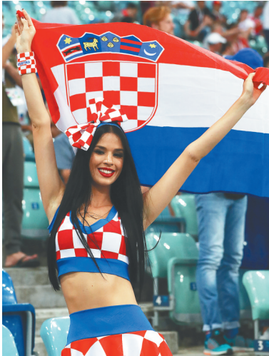
7月8日,一名克罗地亚球迷在俄罗斯与克罗地亚的比赛前造势。

经过近一个月共60场拼杀,俄罗斯世界杯4强出炉。本届世界杯冷门迭爆,巴西、德国、阿根廷等传统豪强同时无缘半决赛,但最终的四强阵容还不算太离谱,法国和英国属传统强队之列,“欧洲红魔”比利时是声名鹊起的“新贵”,克罗地亚也是老牌实力派队伍。 四强晋级过程中的难易程度、对手强弱或不一样,但他们能打进四强,就已充分证明了自己的能力。人们都说世界杯32强无弱旅,现在到了四强,更没有明显的强弱之分,只能说各有特点,各擅胜场。 比利时唯一保持全胜,进攻火力最猛。从小组赛到两轮淘汰赛,只有比利时在常规时间里保持全胜战绩。1/8决赛惊险逆转日本,1/4决赛在场面下风中凭着防守反击击败巴西,也许有人说比利时的胜利不能令人信服,但足球场上只认结果,更何况,能击败公认实力最强的头号热门巴西队,可不是有运气就能做到的。比利时队5战共打进14球,如此凶猛的火力,足以说明他们为什么能走得这么远。