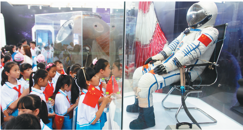
节假日里,文昌航天主题公园迎来青少年学生参观、学习。

“公园最初的功能较为单纯,通常是提供安静的环境,供休息如散步、赏景之用。但是随着社会的发展,现代化的公园又增加了很多功能,综合性的公园一般有观赏游览、安静休息、儿童游戏、文化科学普及、园务服务等内容。大型主题公园则更多采用现代化的科学技术手段,重视寓教于乐的功能。”祁少雄说。