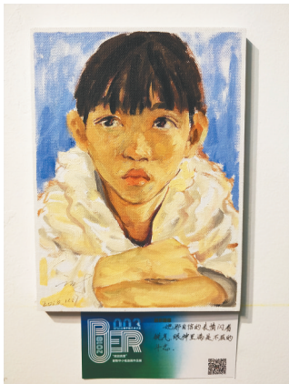
瞪大眼睛认真听讲的学生。