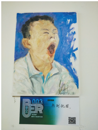
抓住小朋友打哈欠的瞬间。

最直接的后果就是美术人才的缺乏。”就拿动漫来说,受美日动漫的影响,国内动漫争相模仿出来的作品不少,但是动漫产业中能突围的“中国制造”却少之又少。