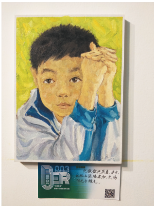
谢斯华善于抓住学生的小动作。