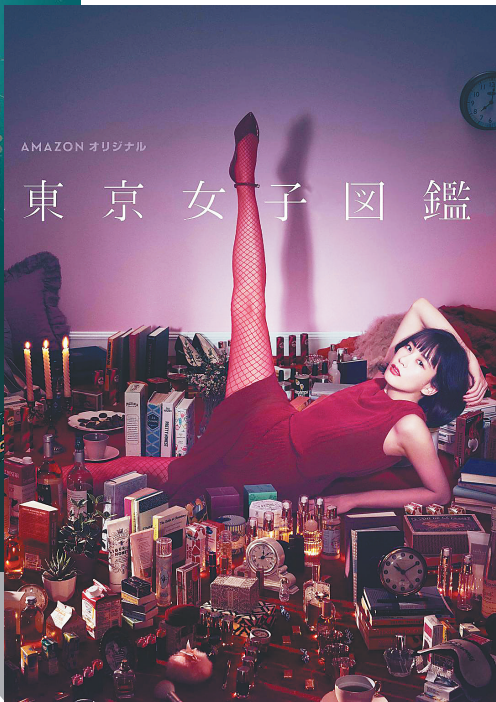
关注都市女性成长的《东京女子图鉴》播出后引发热议。

热播电视剧《上海女子图鉴》和《北京女子图鉴》都脱胎于日本网络剧《东京女子图鉴》，这两部电视剧大体上依照原剧的故事框架，把故事背景置换成了中国最具代表性的两个大城市——北京和上海，讲述了年轻女性在大都市中一步步打拼的职场励志故事。生活中，无论是“北漂”还是“沪漂”都存在很多相似之处，因此可以引发人们的观剧兴趣。