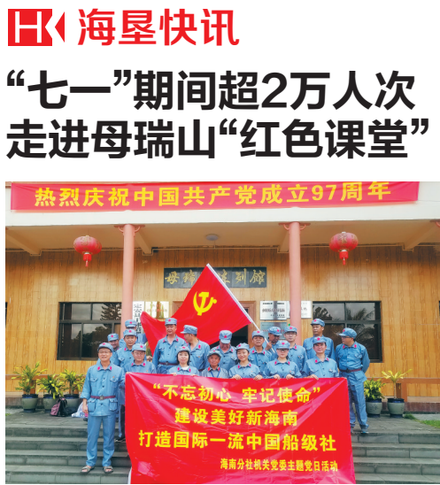
今年“七一”期间，相关单位在母瑞山革命纪念馆开展红色主题教育活动。

同整合优势资源，为海南打造绿色、智能、高效的出行方式，加快推进海南能源消费结构调整。”浙江吉利控股集团有限公司董事长李书福说。 在招商期间，海南农垦务实的工作作风和强劲的综合实力打动许多企业。企业家纷纷表示，海南农垦作为全国第三大垦区，资源丰富，发展潜能巨大，希望与海垦在多元产业合作中擦出火花。 “海垦将打造一流的营商环境，优化服务、极简审批，欢迎广大客商到农垦投资兴业、共谋发展。”梁春发表示，海南农垦将继续抓好百日大招商（项目）活动，重点围绕热带特色高效农业、南繁育制种、海洋牧场、大宗商品、新能源汽车等产业共69个项目开展精准招商，争取引进更多大企业、大项目。