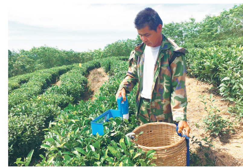
茶农正在用采茶机采茶。

台售价1500元。一个采茶机仅重2.3公斤，主要由锂电池和机身两部分组成，锂电池可持续工作8个小时，具有轻巧便于携带续航时间长等特点。在采茶时，茶工只需手持机身，将电池挂在肩上即可。 “这款采茶机斗的高度还可再加深10厘米，避免采茶时容量不够大，所采茶青边采边掉的现象。箩筐的制作也可根据茶棚的高度及采茶机的大小进行调整，方便作业。”海垦茶业集团党委书记、董事长蔡锦源表示，目前茶业集团的4个茶叶基地都已陆续购进一批采茶机进行试用，摸索经验。通过不断地实验，选择型号最佳的采茶机，摸索最适宜的采茶方式，为日后的机械化采茶做准备。 “采茶业属于密集型劳动，一年四季日晒雨淋，特别看重采茶速度和产量。如今茶工面临着老龄化现象，同时海垦茶业集团的新植茶园面积却在不断扩大，机械化采茶是未来采茶业发展的必然方向。”据蔡