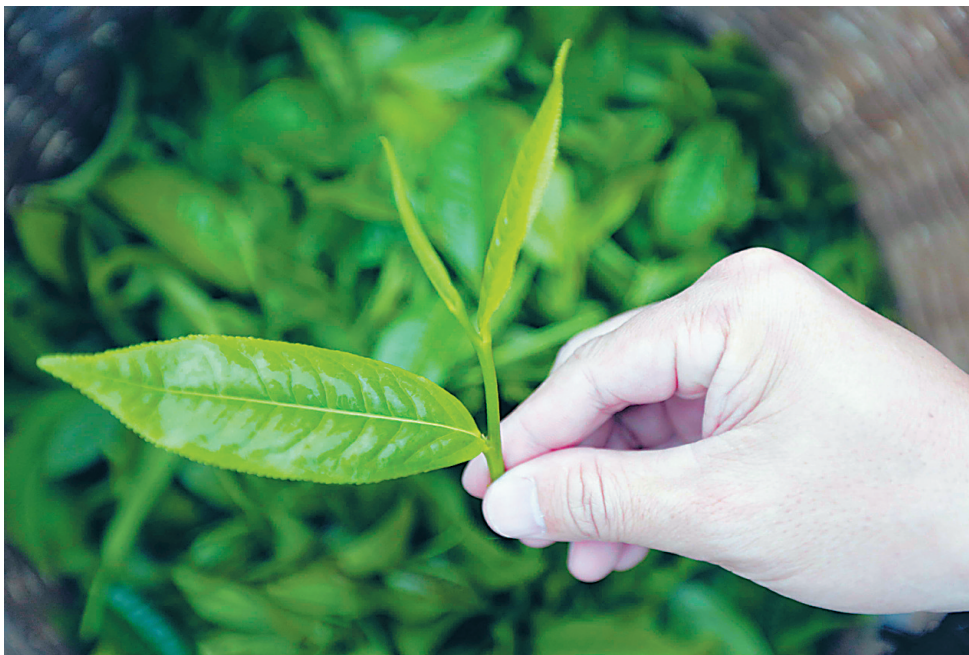
产自琼中乌石农场岭头分场茶园的大叶种茶芽心。

宝岛海南，素有“南溟奇甸”美誉。明代海南名贤丘濬著《南溟奇甸赋》，谓其万山绵延，百川弥茫，神州赤县，全钟其气。茫茫巨浸，与天为界。漠漠平川，壮地之介，兼华夷之所产，备南北之所有。