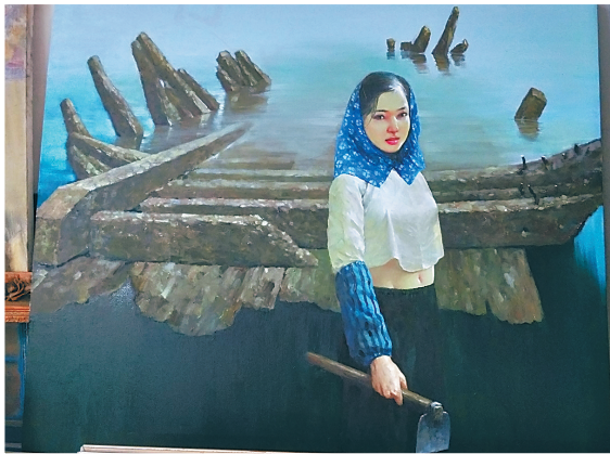
《曾经的海》(油画) 吴官友

为此,特地再介绍他的一幅题为《初春》的油画,供读者留心鉴赏。从中领略那朝气蓬勃的春天气息带给我们的略带羞涩而稚嫩的长远希冀。