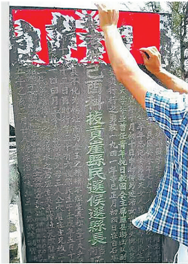
陈金声的墓碑。（资料图片）