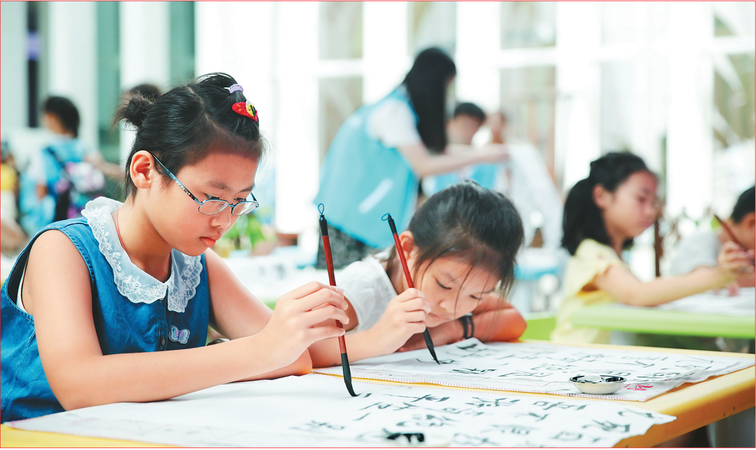
暑期，孩子们在海南省博物馆学习书法。