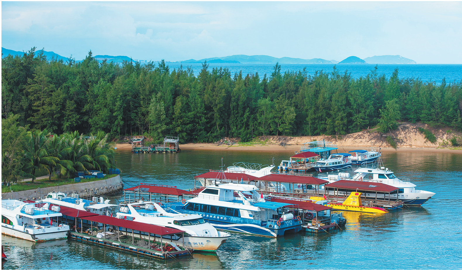
7月17日下午，陵水分界洲岛旅游区码头，航运、观光船只进港避风。17日15时，陵水启动防风防汛Ⅳ级应急响应。截至18时，该县1940艘渔船全部回港避风，33宗水库蓄水总量5748.62万立方米，占总库容27.1%。

本报海口7月17日讯（记者陈雪怡 陈蔚林 特约记者韩小雨 通讯员尹建军 武占超 黄阳 实习生叶润田）省国土资源厅、省海洋与渔业厅、省教育厅分别部署多项工作，落实各项防风防汛措施。 记者今天从省国土资源厅了解到，为防范今年第9号台风“山神”引发地质灾害，该厅已派出3个专家组，前往累计降雨量高、地质灾害威胁严重、预报降雨量大的重点市县，对地质灾害防范工作进行指导和检查，并紧急部署要求各市县国土部门提前防范台风可能引发的地质灾害。