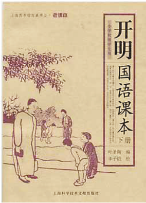
1932年,《开明国语课本》课文均出自叶圣陶先生的手笔,文字和插图都是丰子恺先生亲笔为之。(资料图)