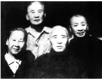
1921年4月,叶圣陶与沈雁冰(前左者)、郑振铎(中坐者)、沈泽民(左站者)合影。(资料图)