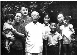
1970年叶圣陶先生与家人合影。前排的男孩是老先生的孙子叶兆言,现在都已成著名作家了。(资料图)

作为文学家的叶圣陶则更加为人所熟知。叶圣陶被誉为“优秀的语言艺术家”,他的《隔膜》《倪焕之》《潘先生在难中》等作品被一代又一代的读者们所称道,而他以文学的方式积极参与社会活动更使人们钦佩不已。