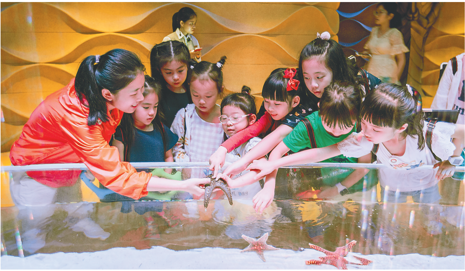
来三亚 开展研学旅行吧！

据悉，《规定》实施有效期为两年。奖励实行申报制，具体申报流程以每年发布的申报通知为准，其中奖励范围和奖励额度按当年实际情况确定，逾期未申报视为企业自行放弃。