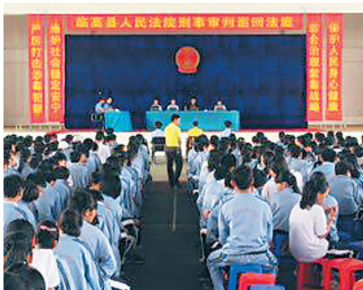
临高县人民法院将法庭“搬进”校园,给师生们上了一堂生动的“禁毒课”。