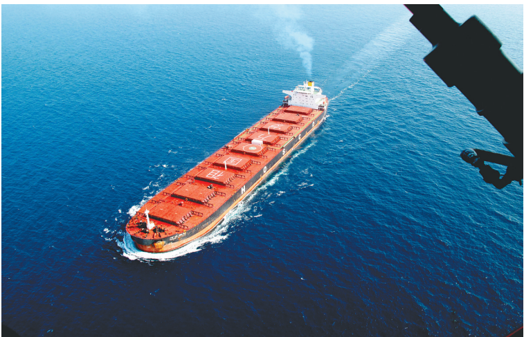
海口舰接护的商船打出“祖国万岁”的标语。