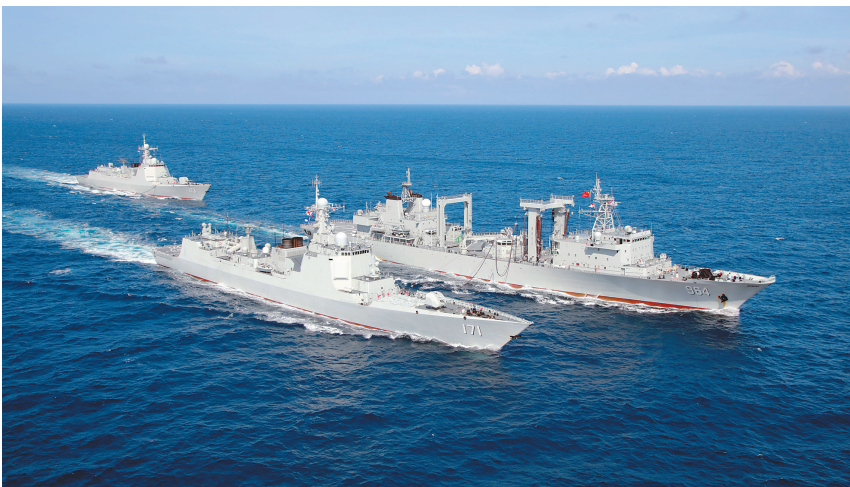
远海训练中，海口舰进行海上补给。