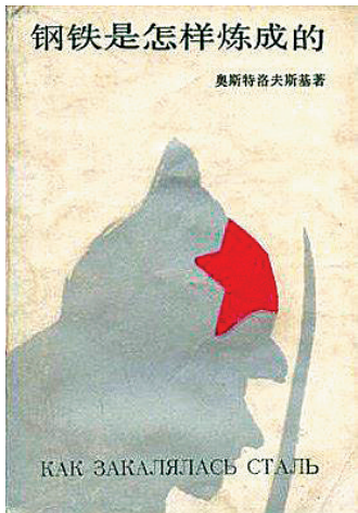
《钢铁是怎样炼成的》封面

正如一千个读者心目中有一千个哈姆雷特,不同年代的书迷也有各自的阅读体验,不同年代的作家亦笔耕不息,用文字存照社会变迁。居住在海南岛的书迷心目中又有哪些温暖过青春的文学作品?7月27日,《遇见海口 最美时光》系列丛书之《岛屿人生》和《岛屿生活》举行新书首发式之际,海南日报记者采访出生于不同年代的老中青书迷,倾听他们芳华岁月的阅读故事。