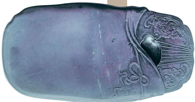
琴形砚(年代:清代 材质:端石)