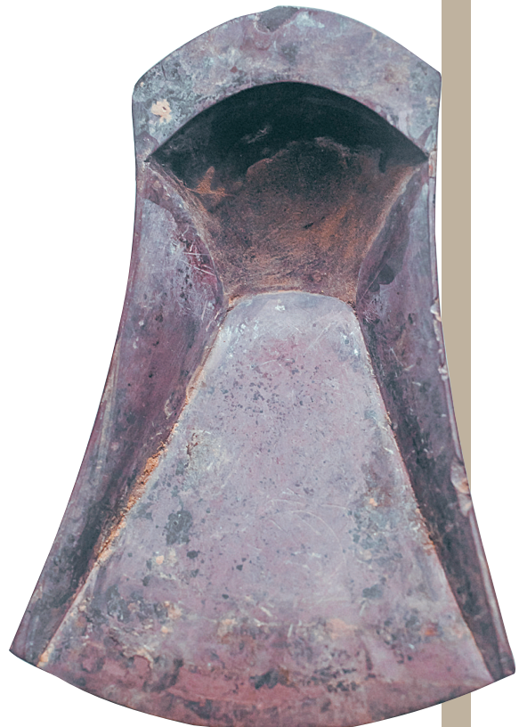
竹凤池砚(箕形砚)(年代:唐代 材质:端石)