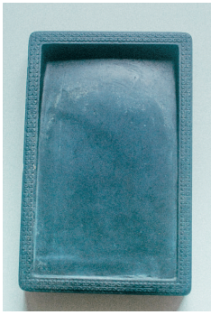
汤池砚(年代:清代 材质:歙石)