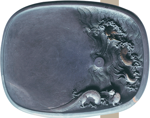
二龙戏珠砚(年代:清代 材质:端石)