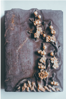
《喜上梅梢》砚(年代:清末—民国 材质:产于四川胡白花石)