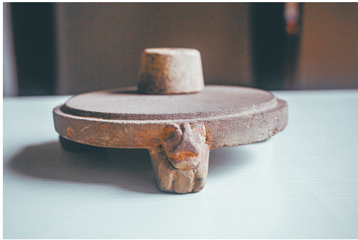
三足虎腿圆形砚(年代:汉代 材质:砂石)

再仔细观赏该砚，色紫微带蓝光，石质极为细腻光滑，抚之冰清若玉，娇嫩如肌，砚面鱼脑冻若隐若现，火捺、青花、蕉叶白、胭脂晕一应俱全，并伴有金银线交织，砚面有活眼两颗，晶莹剔透、碧绿圆润，有眼有珠有晕，非常有生气，还有大片的雨淋墙，极为可贵，以手指轻叩之，发湿木声，此砚确实堪称砚中绝品。