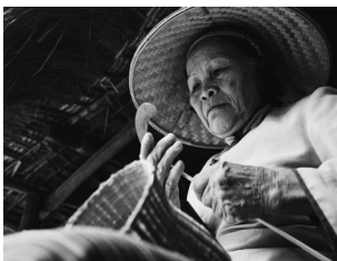
加里克镜头下的海南农村阿婆。