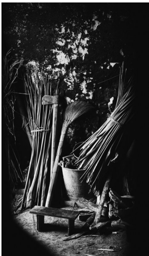
海南村民家中一角。