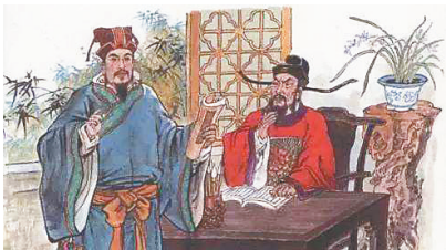
国画中的王安石与苏轼

提起苏东坡与王安石,人们都知道他俩是北宋时期的政治家、文学家,而且王安石是新法的首倡者,苏东坡则是旧党的成员。值得庆幸的是,严肃的政治对垒并不影响他们在文学上的来往。