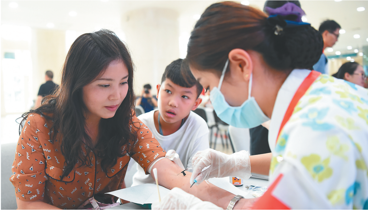
重庆新桥医院一位身着便装的医务工作者接受造血干细胞血样采集。

你可曾知道,口罩之下的无声,是对生命相托的专注;你可曾知道,一袭白衣之下,有颗仁爱济世的至诚之心。 8月19日,全国1174.9万卫生健康工作者将迎来属于自己的节日——首个“中国医师节”。 中共中央总书记习近平近日作出重要指示强调,弘扬救死扶伤的人道主义精神,不断为增进人民健康作出新贡献。 党的十八大以来,我国卫生健康工作者勇担使命、仁心济世,唱响护佑生命的大爱行歌,汇聚起健康中国建设的磅礴力量,为民族复兴的光荣梦想不断夯实健康之基。