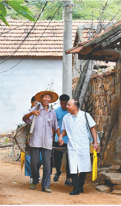
山东沂水县乡村医生巡诊。