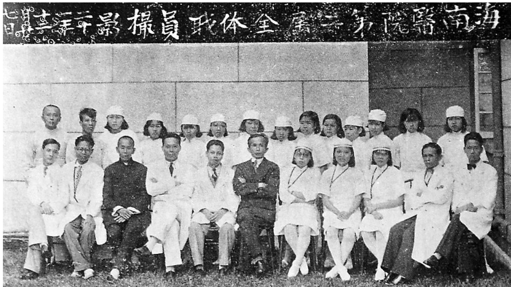
一九三三年,海南医院全体职员合影。

自1858年中英《天津条约》签订后,海南岛成为被迫开放的十大港口之一。外国传教士、商人、社会学者纷纷南下登上这个海岛,这其中包括一位中文名为治基善的独立传教士。