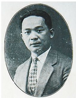
朱润深像 (资料图片)