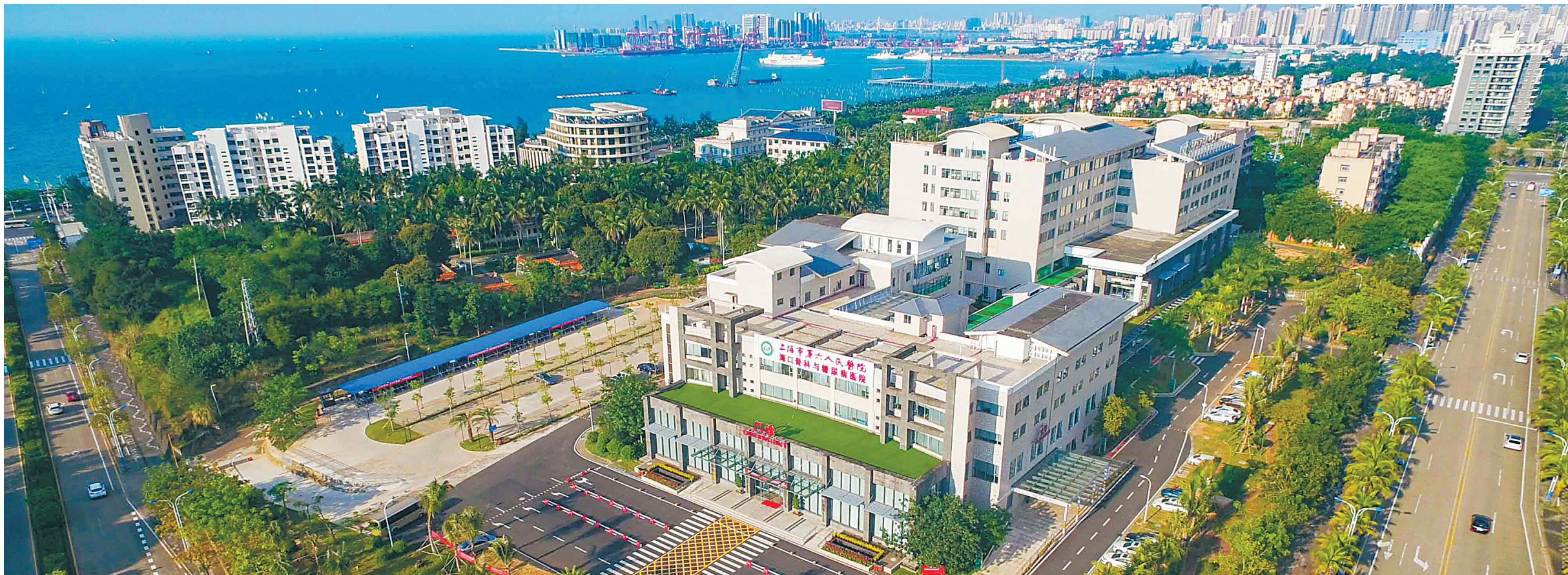
海口市骨科与糖尿病医院。