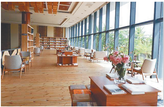
陵水非你不可书局