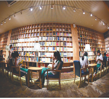
市民和学生琼海共享书房看书。

崭新的图书、漂亮的书架、开放敞亮的阅读环境，较之传统图书馆，这里更便捷、服务更周到；较之其他银行，这里则更像是书香萦绕的新型图书馆。据了解，省图书馆为每家社区书屋配图书1500册，图书主要以新书、畅销图书为主，图书种类包括少儿读物、绘本图书、社会科学、文学和自然科学等，凭光大银行卡或省