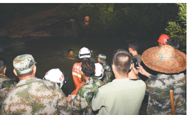
救援现场。

本报八所8月27日电（记者良子 通讯员韩鹏飞）8月26日晚，东方市江边乡新明村后山面上有3名人员被洪水围困，东方市消防支队接到报警后迅速赶赴现场，经过奋力营救，将被困人员成功救出。 26日19时52分，东方市消防支队接到报警后立即调派消防车、冲锋舟和消防官兵赶赴现场。21时40分，消防官兵抵达新明村，经了解得知，距离被困人员所在位置仍有约7公里，沿途道路狭小泥泞，路上淹水地方较多，消防车无法进入。消防官兵当即转乘村民的摩托车行驶约5公里，再涉水徒步步行进约2公里，才到达被困人员位置。 22时30分，消防官兵到达现场。经现场勘查：河流宽约14米，现场因暴雨导致河面上涨、水流湍急，河对岸有3名人员被困。了解情况后，消防官兵按照现场指挥将救援绳索一端徒手抛掷到河对岸。在被困人员将绳索固定后，现场村民拉着另外一端绳索协助进行救援。准备工作完成后，1名消防官兵沿绳索涉水到过河对岸，协助被困人员带上安全腰带，并做好安全保护。随后，被困人员逐一拉着救援绳渡河回到安全区域。22时50分，现场被困人员全部救出。 据了解，3名被困人员是当天上午8时许在当地护林员向导的带领下进入山林进行土地勘察。13时许，突然天降暴雨，4人在回程途中，遇到河面上涨，其中1人强行涉水回到安全区域，其余3人因不熟悉水性无法过河被困。