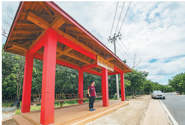
《玉道村候车亭》拍摄点：东方玉道村