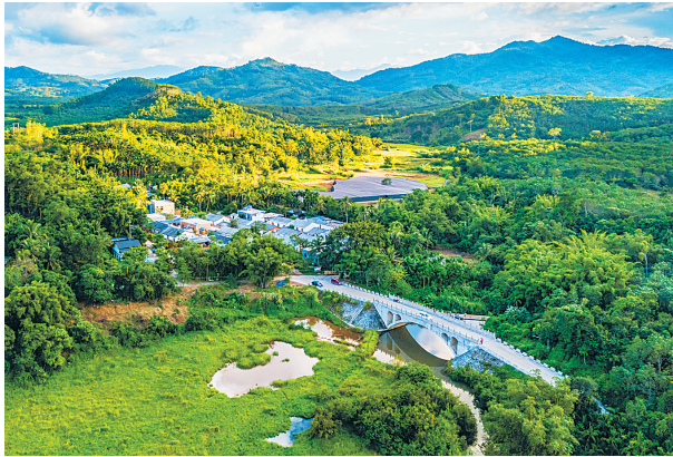
《小桥连着致富路》拍摄点：琼中什旦宛