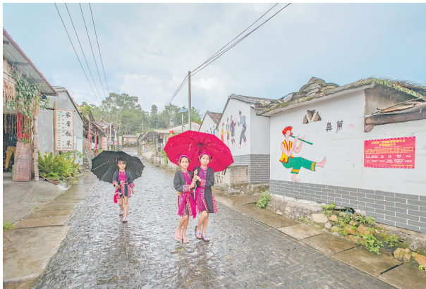
《雨中漫步》拍摄点：琼中什寒村