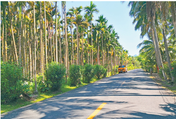
《槟榔公路》拍摄点：琼海博鳌镇