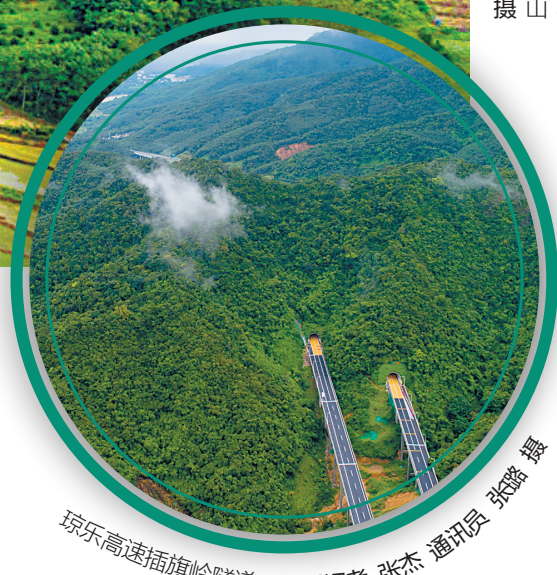
琼乐高速插旗岭隧道。

同时，省交通运输厅还将推动“交通+特色产业”扶贫，改善我省贫困地区旅游景区的交通条件，提升旅游运输服务供给质量，满足深度游、观光游、农家游等方面的交通服务需求。 此外，该厅还将整合交通运输、邮政快递等农村物流资源，不断完善县、乡、村三级农村物流体系，畅通农产品销售、生产资料和生活消费品下乡的物流通道。 （本报海口8月30日讯）