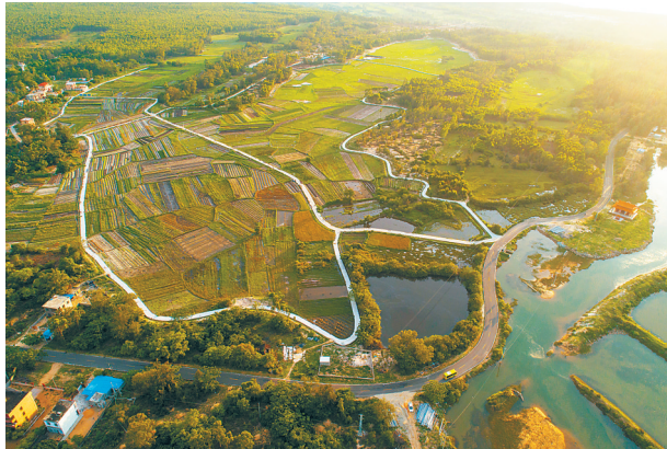
《美丽乡村公路》拍摄点：昌江海尾镇

今年6月省交通运输厅举办全省“四好农村路”发展成果摄影大赛的通知发出后，许多单位和个人踊跃投稿，一批优秀摄影作品脱颖而出。为更全面地反映我省“四好农村路”建设成就，助力打赢脱贫攻坚战和实施乡村振兴战略，省交通运输厅决定，将比赛投稿截止时间延长至2018年10月10日，投稿邮箱：shnclsyds@163.com。 今日本报选登征集到的部分优秀摄影作品，以飨读者。