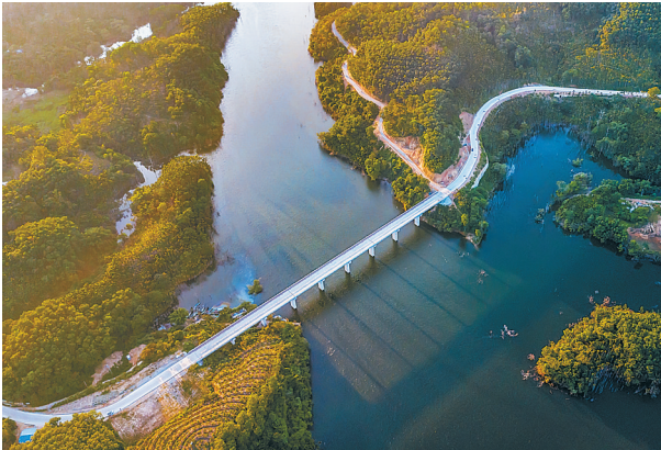
《通向远方》拍摄点：琼中红岭大桥