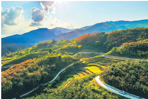
《牙胡梯田旁的公路美景》拍摄点：五指山牙胡村